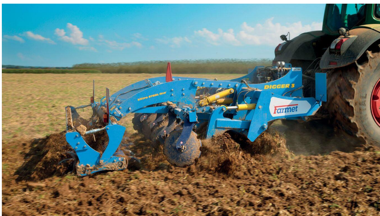
Farmet podrivač Digger 3N

Shodno Vašem interesovanju, kao zvanični zastupnik češke kompanije Farmet , dostavljamo Vam ponudu za nošeni podrivač Digger 3N .